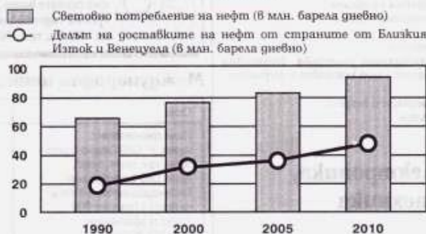
Нуждата от внос на нефт ще расте по-бързо от потребностите

Прогнозата се базира при следните изходни данни: 1) Средногодишен икон. растеж в света 3% за периода 1990-2005 г. 2) Нарастване на средната межд. цена на нефта от 20$ през 1990 г. на 30$ през 2010 г.