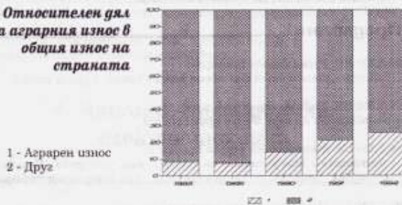
Относителен дял на аграрния износ в общия износ на страната